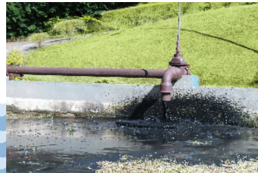
Estação de tratamento de esgoto

Além disso, o usuário que destina inadequadamente seu esgoto gera uma série de transtornos ao Simae, pois há materiais que acabam passando pela peneira e muitas vezes ficam retidos no rotor da bomba fazendo com que este pare de funcionar, necessitando efetuar manutenção ou a substituição do conjunto motorbomba.