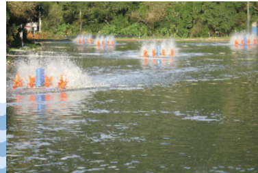
Estação de tratamento de esgoto

O Simae coleta e trata o esgoto de 62% da área urbana do município de Joaçaba, 82% da área urbana do município de Herval d'Oeste e 95% da área urbana do município de Luzerna. Para aumentar a cobertura de esgotamento sanitário e atender aos Planos Municipais de Saneamento, que prevê a universalização da coleta e tratamento de esgoto sanitário até 2030. Para atender 100% da população urbana é necessário um investimento de grande monta, para isso parte dos recursos arrecadados é utilizado para expansão e melhorias das redes de esgoto.