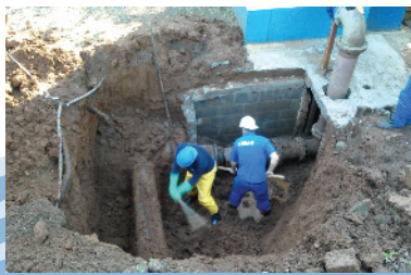
Manutenção de adutora de recalque

Amostras de esgoto são coletadas e analisadas no laboratório do Simae e semestralmente, através de empresa contratada, que realiza a coleta e análise do esgoto, inclusive da água do rio antes e depois da saída das ETEs, para verificar o atendimento às legislações ambientais.