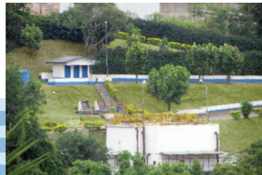
Estação de tratamento de esgoto