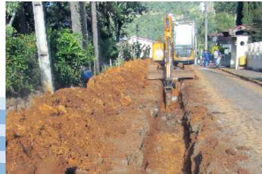
Implantação de rede coletora