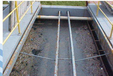
Estação de tratamento de esgoto