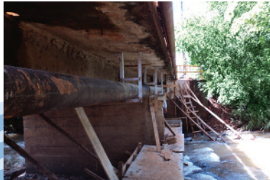
Rede de esgoto

O esgoto de seu imóvel, gerado a partir do momento que você abre a torneira da pia, dá descarga, lava roupas, toma banho, enfim todas as águas servidas, necessita de infraestrutura para chegar até a estação de tratamento. Essa estrutura é composta de redes, poços de visita, elevatórias, estação para tratamento de esgoto.