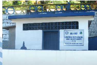
Elevatória de esgoto