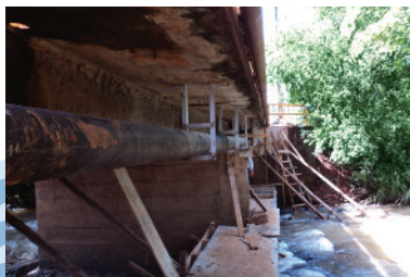
Rede de esgoto

O esgoto de seu imóvel, gerado a partir do momento que você abre a torneira da pia, dá descarga, lava roupas, toma banho, enfim todas as águas servidas, necessita de infraestrutura para chegar até a estação de tratamento. Essa estrutura é composta de redes, poços de visita, elevatórias, estação para tratamento de esgoto.