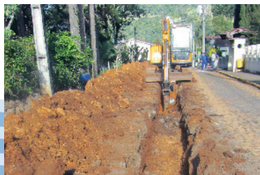
Implantação de rede coletora