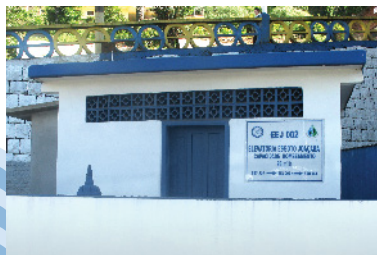
Elevatória de esgoto