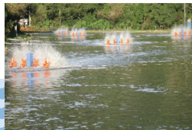
Estação de tratamento de esgoto

O Simae coleta e trata o esgoto de 62% da área urbana do município de Joaçaba, 82% da área urbana do município de Herval d'Oeste e 95% da área urbana do município de Luzerna. Para aumentar a cobertura de esgotamento sanitário e atender aos Planos Municipais de Saneamento, que prevê a universalização da coleta e tratamento de esgoto sanitário até 2030. Para atender 100% da população urbana é necessário um investimento de grande monta, para isso parte dos recursos arrecadados é utilizado para expansão e melhorias das redes de esgoto.