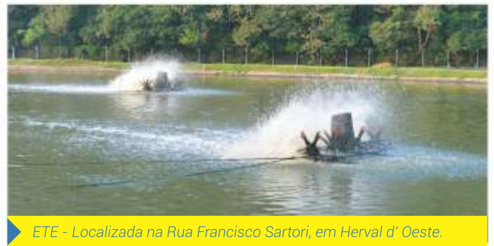
ETE - Localizada na Rua Francisco Sartori, em Herval d' Oeste.

A ETE Herval d'Oeste trata o esgoto coletado nos municípios de Joaçaba e Herval d'Oeste. O tratamento inicia com uma unidade de pré-tratamento, que visa a remoção dos sólidos mais grosseiros que chegam com o efluente bruto. Posteriormente o efluente passa por duas lagoas aeradas facultativas, onde o tratamento ocorre pela ação de microrganismos predominantemente aeróbios, seguidas de uma lagoa de maturação que tem por objetivo a remoção de organismos patogênicos.