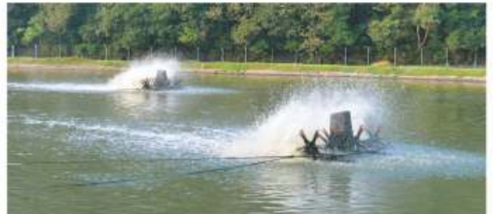
ETE - Localizada na Rua Francisco Sartori, em Herval d' Oeste.

A ETE Herval d'Oeste trata o esgoto coletado nos municípios de Joaçaba e Herval d'Oeste. O tratamento inicia com uma unidade de pré-tratamento, que visa a remoção dos sólidos mais grosseiros que chegam com o efluente bruto. Posteriormente o efluente passa por duas lagoas aeradas facultativas, onde o tratamento ocorre pela ação de microrganismos predominantemente aeróbios, seguidas de uma lagoa de maturação que tem por objetivo a remoção de organismos patogênicos.