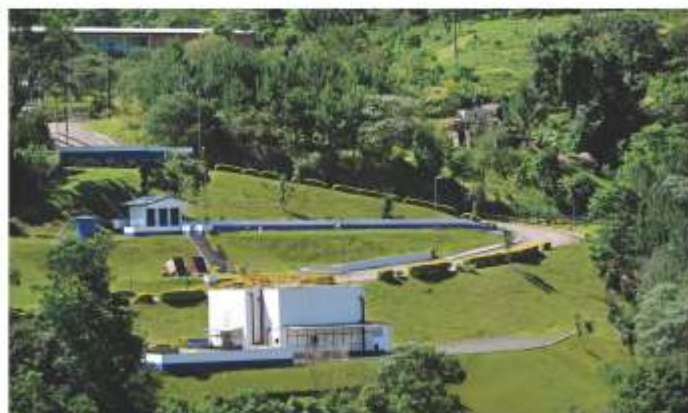
ETE - Localizada na Rua Frei João, s/n, em Luzerna.

A ETE Luzerna é responsável por tratar o esgoto coletado no município de Luzerna. Essa ETE é composta de uma unidade de pré-tratamento para remoção de sólidos grosseiros, seguida de um reator anaeróbio e de filtros biológicos aerados que promovem a remoção da matéria orgânica presente no mesmo.