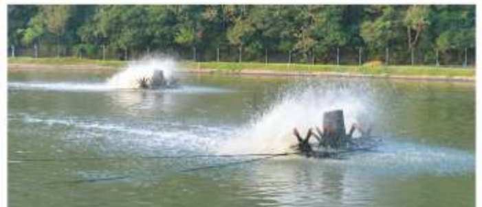
ETE - Localizada na Rua Francisco Sartori, em Herval d' Oeste.

A ETE Herval d'Oeste trata o esgoto coletado nos municípios de Joaçaba e Herval d'Oeste. O tratamento inicia com uma unidade de pré-tratamento, que visa a remoção dos sólidos mais grosseiros que chegam com o efluente bruto. Posteriormente o efluente passa por duas lagoas aeradas facultativas, onde o tratamento ocorre pela ação de microrganismos predominantemente aeróbios, seguidas de uma lagoa de maturação que tem por objetivo a remoção de organismos patogênicos.