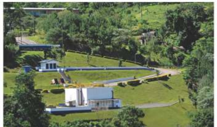
ETE - Localizada na Rua Frei João, s/n, em Luzerna.

A ETE Luzerna é responsável por tratar o esgoto coletado no município de Luzerna. Essa ETE é composta de uma unidade de pré-tratamento para remoção de sólidos grosseiros, seguida de um reator anaeróbio e de filtros biológicos aerados que promovem a remoção da matéria orgânica presente no mesmo.