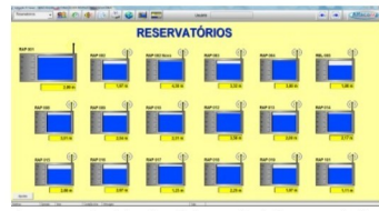
Imagem da tela do sistema de telesupervisão

utilizadas para verificar se há perdas de água na região abastecida.