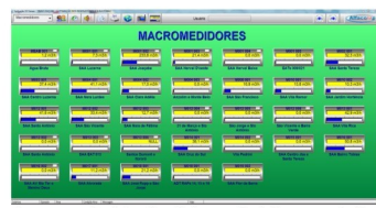
Imagem da tela do sistema de telesupervisão

Estes dados, retirados dos macromedidores, servem de base para acompanhamento e controle diário dos volumes distribuídos.